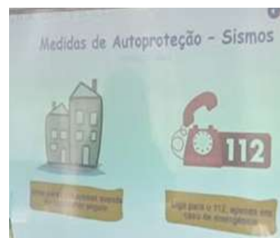
Os alunos praticaram a evacuação da sala de aula